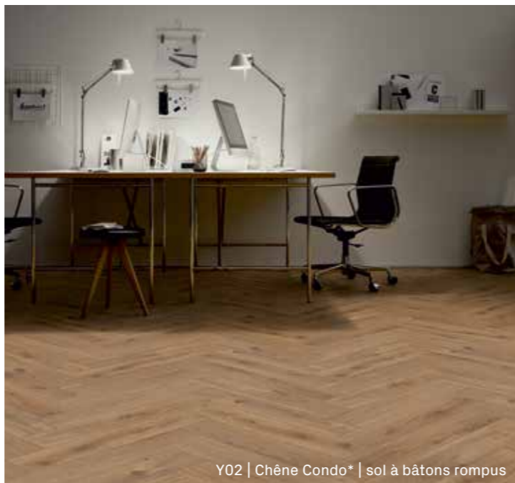
Y02 | Chêne Condo* | sol à bâtons rompus

Y02 1101021803 | 665x133x10 mm | sol à bâtons rompus