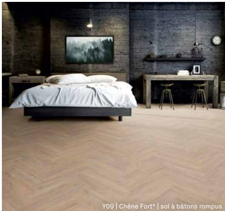
Y09 | Chêne Fort* | sol à bâtons rompus