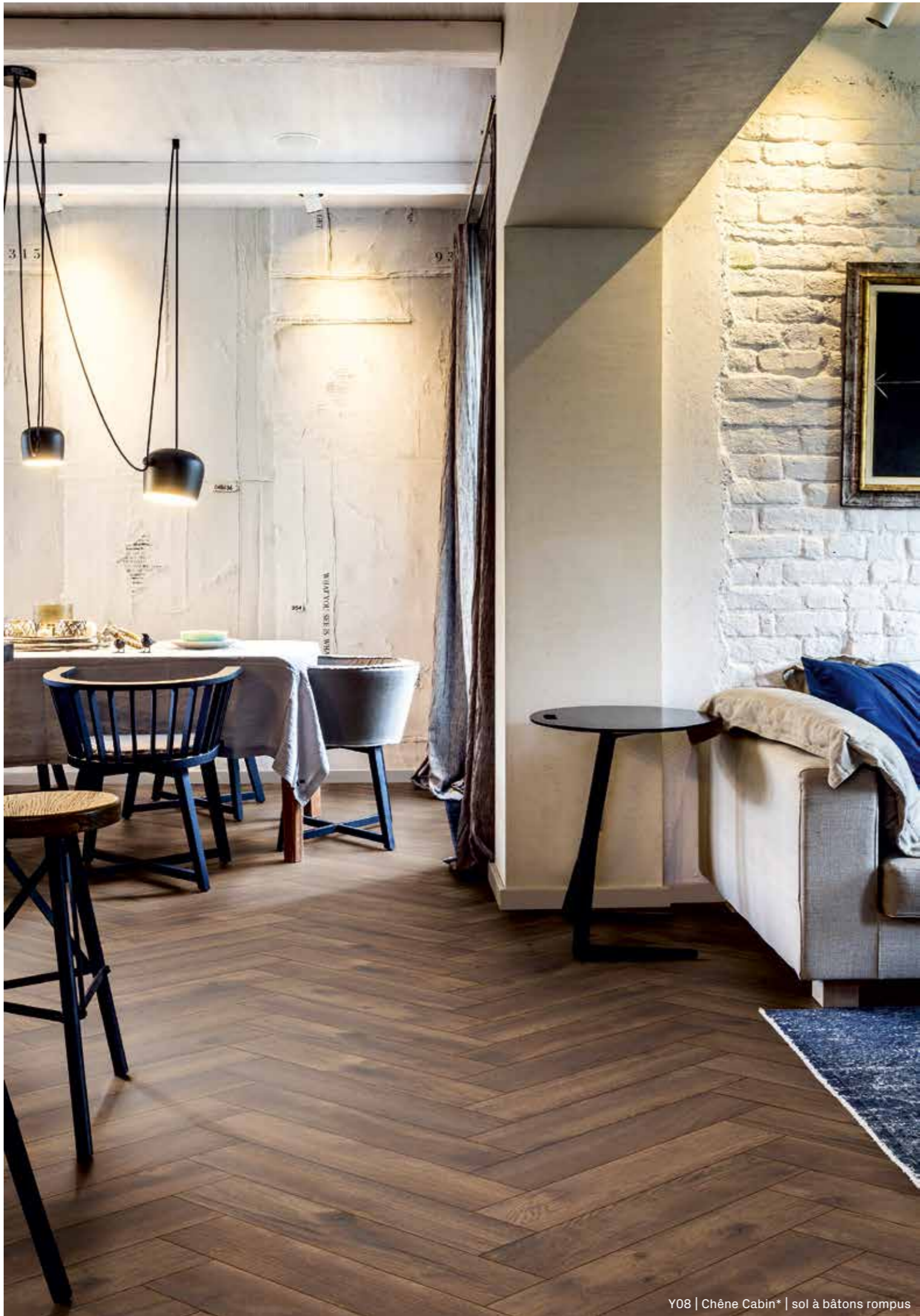
Y08 | Chêne Cabin* | sol à bâtons rompus