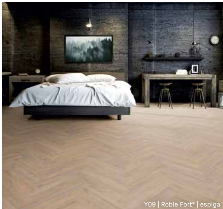
Y09 | Roble Fort* | espiga