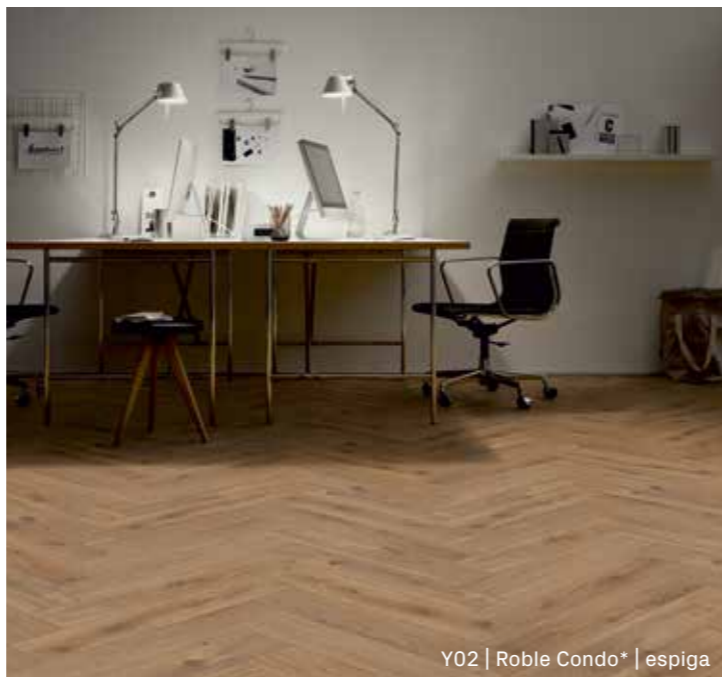
Y02 | Roble Condo* | espiga